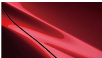
晶艷魂動紅* 加價一萬五千元